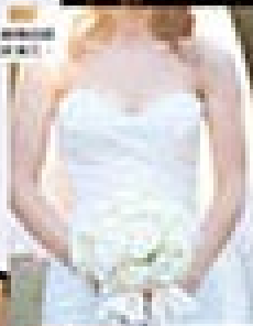
新娘手捧花 來自 The Wedding Dress

高層華麗婚紗的精華 「高層華麗婚紗」是婚紗界的一股新風潮，它結合了傳統婚紗的優雅與現代婚紗的時尚感。這種婚紗通常採用高層紗綉、蕾絲、珠片等元素，營造出華麗、立體的視覺效果。在設計上，它往往更注重細節的雕琢，如精緻的刺繡、手工縫製的珠飾等，展現出極致的工藝美。此外，高層華麗婚紗的剪裁也更具立體感，能很好地襯托新娘的優雅氣質。在搭配上，它通常會選擇精緻的頭紗、手套和婚鞋，整體呈現出一種古典而奢華的婚禮氛圍。