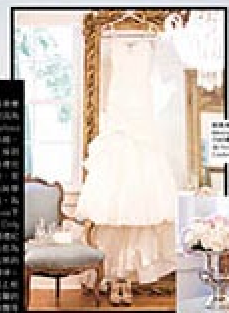
婚紗 來自 The Wedding Dress