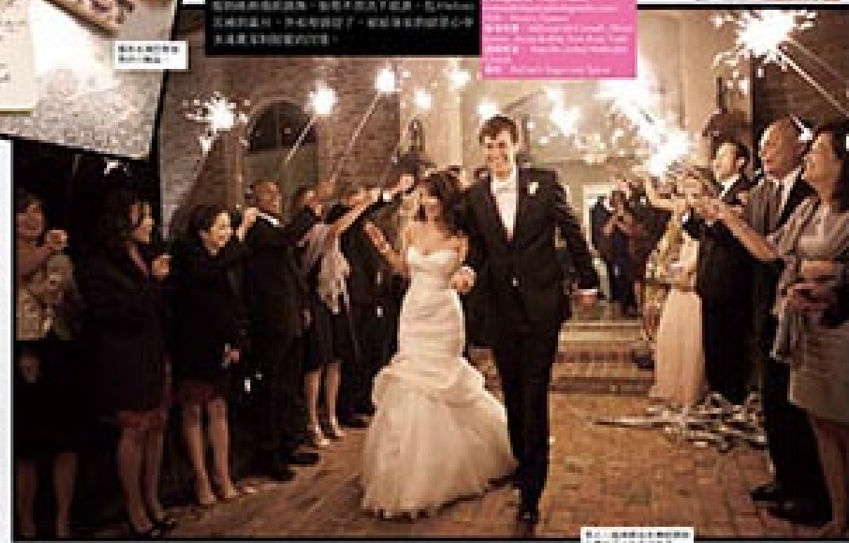
婚禮攝影