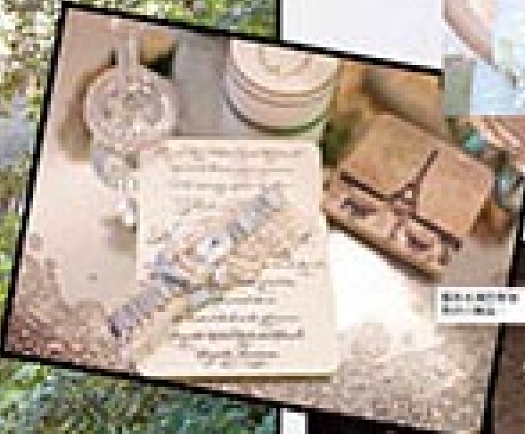
喜帖 來自 The Wedding Dress

高層華麗婚紗的精華 「高層華麗婚紗」是婚紗界的一股新風潮，它結合了傳統婚紗的優雅與現代婚紗的時尚感。這種婚紗通常採用高層紗綉、蕾絲、珠片等元素，營造出華麗、立體的視覺效果。在設計上，它往往更注重細節的雕琢，如精緻的刺繡、手工縫製的珠飾等，展現出極致的工藝美。此外，高層華麗婚紗的剪裁也更具立體感，能很好地襯托新娘的優雅氣質。在搭配上，它通常會選擇精緻的頭紗、手套和婚鞋，整體呈現出一種古典而奢華的婚禮氛圍。